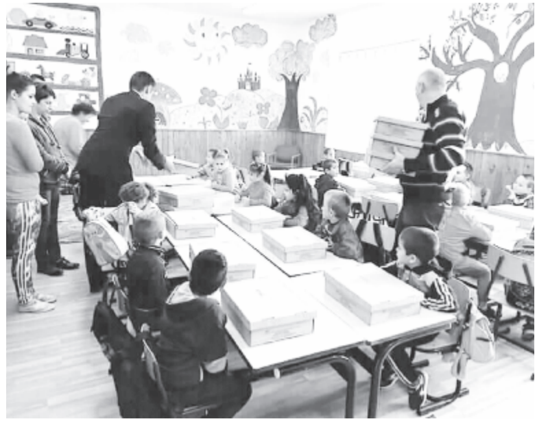
Az előkészítők dobozban, a többiek hátitáskában kapták meg a gyáliak ajándékát

A megújult iskolaudvarral kapcsolatban az előjáró elmondta: a területet régen röplabdapálya foglalta el, de nagyon tönkrement, ezért a helyet az önkormányzat lekövetette, aztán megszületett az ötlet, hogy le kellene aszfaltozni, és több-