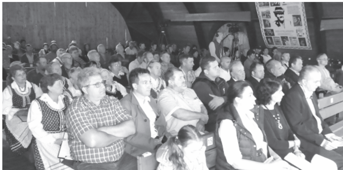
Számos szakmai előadást és néptáncbemutatót láthatott-hallhatott a közönség