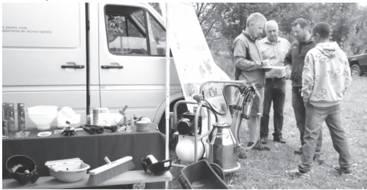
Több gazdakör, termelő, szakvállalat mutatkozott be a mikházi rendezvényen