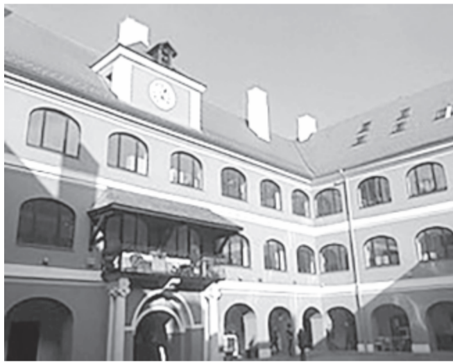
Az iskola felújított udvara 2017-ben

Kovács Irén Erzsébet, a román oktatásügyi minisztérium kisebbségi oktatásért felelős államtitkára szerint jelentősek az erdélyi magyar oktatásban elért eredmények, de ugyanolyan nagyok az újra és újra jelentkező kihívások is. Az államtitkár a jövő ellehetetlenítését kísérletének nevezte a román nyelv elemi iskolai tanításának a kedvezőtlen módosítását.