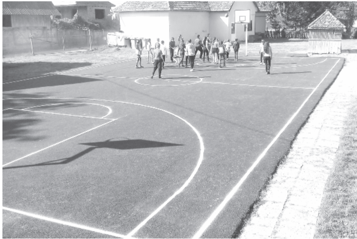
A diákok örömmel vették birtokba az új pályát